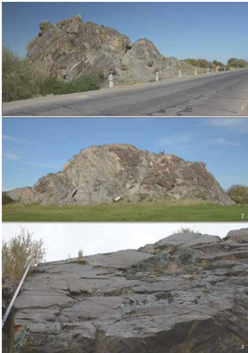
Рис. 1. Скала Чандмань хар узуур: 1 – общий вид на памятник с дороги, ведущей из Ховда в Улаанбаатар; 2 – южный склон горы с основным местонахождением петроглифов; 3 – отвесные скальные плоскости с наиболее древними рисунками