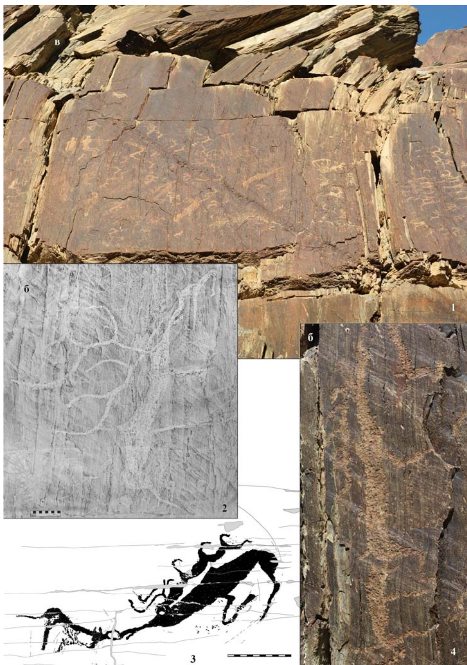
Рис. 1. Монгольский Алтай. Скала Ханын Хад и петроглифы в стиле оленных камней: 1 – общий вид скалы Ханын Хад с условно выделенными участками скопления плоскостей с петроглифами; 2 – расположение памятника на карте; 3 – петроглифы участка «а»; 4 – петроглифы участка «б»

Среди многочисленных памятников наскального искусства Монгольского Алтая одним из наиболее известных местонахождений остается скала Ханын Хад (рис. 1, 1), расположенная в ущелье Яманы Ус на территории Алтай сомона в Ховдском аймаке Монголии (рис. 1, 2). Уникальные изображения крытых повозок в сопровождении