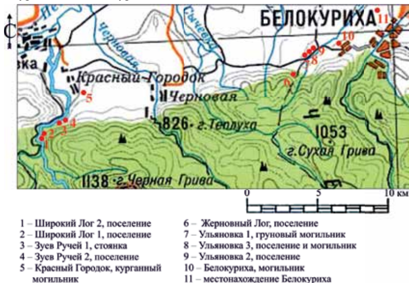
Рис. 1. Археологические памятники в окрестностях Белокурихи

В результате проведенных архивных и полевых изысканий было установлено, что непосредственно на территориях указанных субкластеров расположен целый ряд памятников: «Стоянка Зуев Ручей-1», «Поселение Зуев Ручей-2», «Поселение Широкий Лог-1», «Поселение Широкий Лог-2», «Курганный могильник Красный Городок-1», «Могильник Белокуриха», «Грунтовый могильник Ульяновка-1», «Поселение Ульяновка-2», «Ульяновка-3, поселение и могильник», «Поселение Жерновный Лог». Кроме того, на территории непосредственно Белокурихи находится одноименный могильник, а также место обнаружения бронзового псаля (рис. 1). В процессе исследования территории субкластеров была составлена карта перспективных для дальнейшего поиска археологических объектов участков, а также разработан проект с рекомендациями по использованию историко-культурного наследия в туристическо-экскурсионной деятельности.