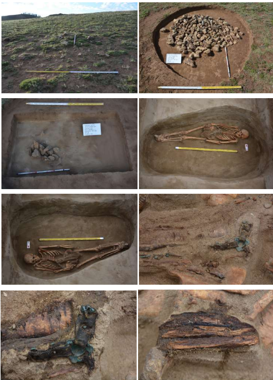
Элст хөтлийн УБ-03 –ын Түрэг бушины малтлагын ерөнхий байдал