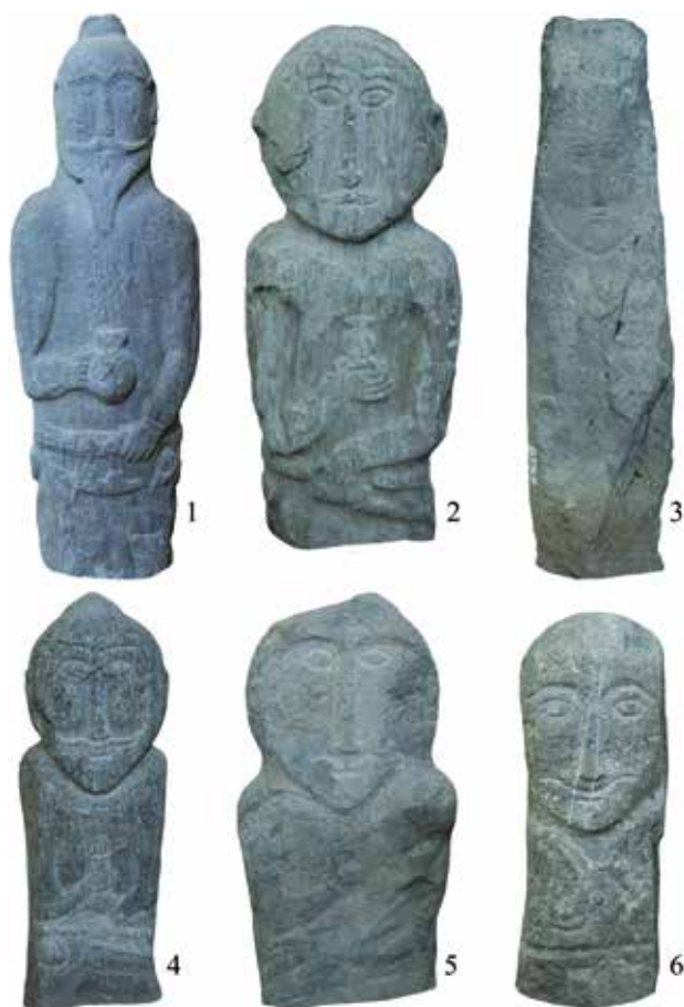
Рис. 3.14. Тюркские изваяния в экспозиции Национального музея Республики Алтай им. А.В. Анохина. Фотоснимки Н.Н. Серегина

Центральными фигурами рисунков, которые тюрки создавали в местах кочевых троп, были конные воины-катафрактары, защищенные тяжелым доспехом. Кроме того, на изображениях представлены сцены охоты – конной и пешей, коллективной и индивидуальной. Практически во всех случаях охотники вооружены луком со стрелами. В нескольких композициях были прорисованы собаки, известны сцены охоты с ловчей птицей. Наиболее популярными объектами охоты, судя по рисункам, являлись представители семейства оленевых (маралы и косули). Также встречаются изображения горных козлов, архаров, кабанов, медведей, волков и птиц. Важно отметить, что роль охоты у тюрок не ограничивалась только ее хозяйственным значением. Как и у многих кочевых народов, у номадов Алтая она могла выступать в качестве военных тренировок в мирное время.