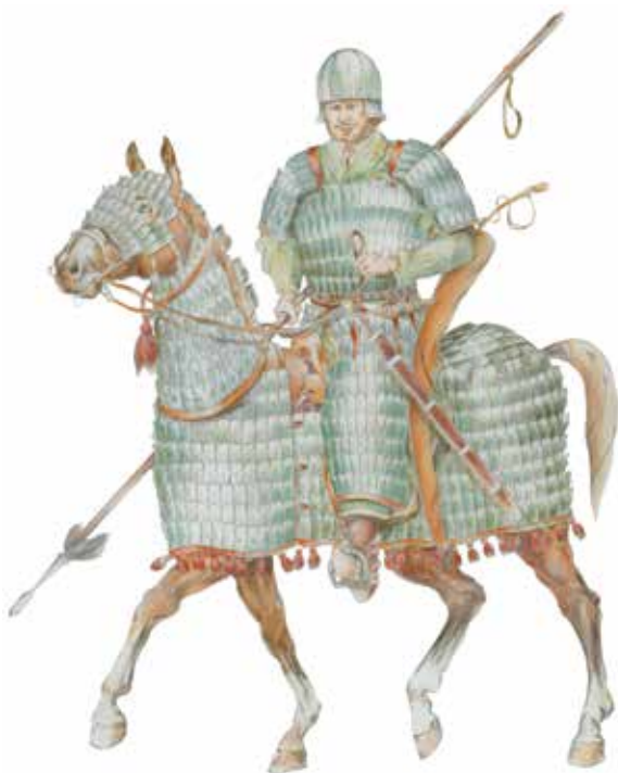
Рис. 3.17. Тюркский тяжеловооруженный воин (катафрактарий). Реконструкция В.В. Горбунова, рисунок Г.Л. Нехведавичюса