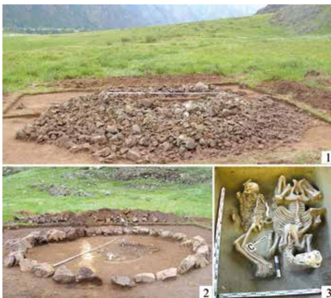
Рис. 3.12. Погребальные сооружения и обряд тюрков Алтая: 1–2 – наземная конструкция кургана №1 комплекса Бике-IV. 3 – захоронение человека с лошадью на памятнике Бирюзовая Катунь-9.

Как видно из краткого обзора политической истории тюрков, реконструкция многих сторон их жизни основана на изучении археологических памятников. К настоящему времени курганные могильники, поминальные сооружения, а также наскальные рисунки кочевников изучены практически во всех частях региона, располагаясь как в котловинах, так и в высокогорных долинах. У тюрков Алтая сложились устойчивые традиции погребального обряда, которые демонстрируют особую систему мировоззрения кочевников (рис. 3.12). Умершего человека обычно укладывали в неглубокую могильную яму, причем хоронили его головой по направлению к востоку (восходу солнца). Рядом с покойным помещали коня – верного спутника кочевника. В могилы богатых тюрков укладывали несколько лошадей, что символизировало достаток человека при жизни. При этом конь в могиле был ориентирован в противоположную от человека сторону – на запад. Вероятно, данная традиция отражала последний путь умершего в загроб-