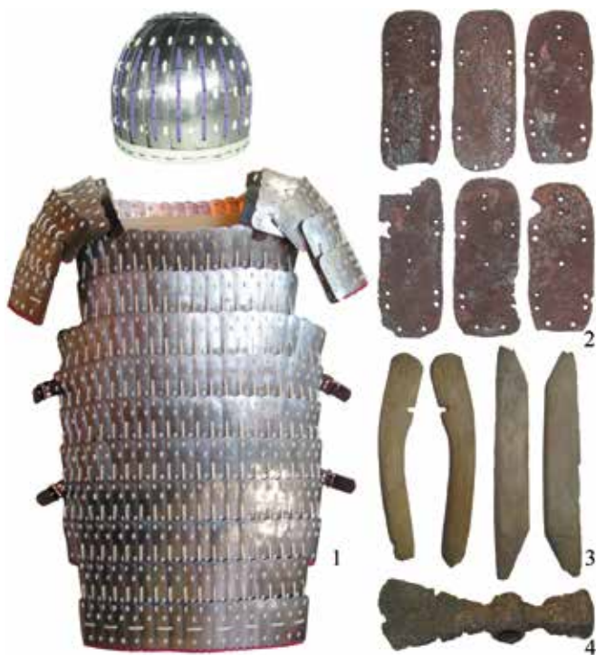
Рис. 3.16. Реконструкция тюркского шлема и панциря (1; выполнена под руководством В.В. Горбунова); предметы вооружения и защитного снаряжения тюрков (2–4).

Помимо войны и охоты, ключевым занятием тюрков Алтая было кочевое животноводство, представлявшее собой основную отрасль хозяйства. Судя по имеющимся сведениям, наиболее важными домашними животными были лошади. Это подтверждают результаты раскопок археологических памятников, где конь присутствует как боевой спутник и проводник в загробный мир. Известно, что занятие животноводством было весьма почетным для кочевника. Конь считался одним из показателей достатка человека, от него во многом зависела жизнь воина в бою. Поэтому большое внимание кочевники уделяли снаряжению лошади (рис. 3.18). В раннем средневековье на Алтае появились стремена, обеспечивавшие устойчивость посадки всадника и эффективность управления конем. Тюрки не были изобретателями стремян (они появились на севере Китая