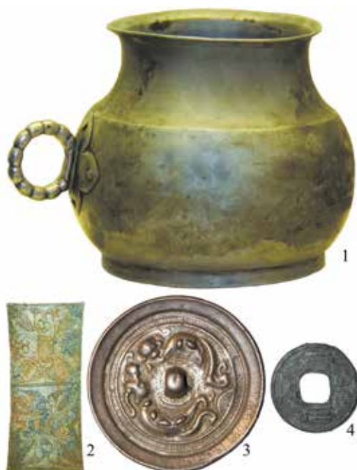
Рис. 3.20. Металлический сосуд (1), костяной орнаментированный игольник (2), металлическое зеркало (3) и китайская монета (4) из погребальных комплексов тюрков: 1 – Туэкта, 2 – Узунтал, 3 – Шибе-II, 4 – Кудыргэ.

свойства рассматриваемого материала. Очевидно, изделия из шелка стали неотъемлемой частью материальной культуры тюрков Алтая, что отразилось в их использовании не только в быту, но и в погребальном обряде. Более редкими находками были китайские монеты. Судя по всему, эти изделия не использовались тюрками как некий эквивалент стоимости, а служили украшениями или амулетами. Вероятно, какие-то особые представления были связаны и с использованием кочевниками Алтая китайских металлических зеркал. При этом нет сомнений, что все предметы «импорта» отражали довольно высокий статус их владельцев.