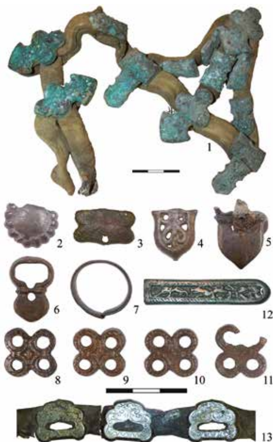
Рис. 3.19. Украшения конского снаряжения и элементы костюма из погребений тюрок разных памятников Алтая: 1 – могильник Жана-Аул; 2–12 – Кудыргэ, 13 – Узунтал.

Особой страницей истории тюрок были отношения с могущественным южным соседом – Китаем. О том, что кочевники Алтая имели какие-то прямые или опосредованные контакты с Поднебесной империей, свидетельствуют «импортные» вещи, которые обнаружены в археологических памятниках (рис. 3.20.-3-4). Наибольшую ценность имели китайские шелковые изделия. Сравнительно широкое распространение шелка в среде тюрок Алтая определялось несколькими обстоятельствами. Безусловно, важной была эстетическая составляющая. Одежда из орнаментированных шелковых тканей демонстрировала определенное положение кочевника в обществе. Не меньшее значение имели известные гигиенические