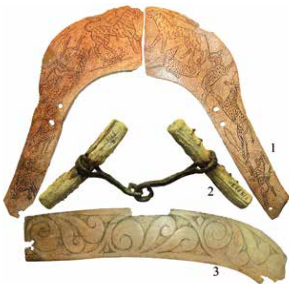
Рис. 3.18. Предметы конского снаряжения: 1 – Кудыргэ. Фотоснимок А.А. Тишкина; 2–3 – Катганда-II. Фотоснимки Н.Н. Серегина

в среде сяньбийских племен), однако именно они быстро освоили и распространили этот элемент снаряжения на огромные территории. Кроме того, тюрками стали широко применяться седла с высокими деревянными полками и луками (рис. 3.18.-1). Снаряжение лошадей, принадлежавших богатым кочевникам, включало также многочисленные украшения узды, которые нередко изготавливались из серебра и золота (рис. 3.19.-1–5, 12). Вторым по значимости был мелкий рогатый скот. В захоронениях тюрков Алтая кости овец присутствуют в качестве остатков погребальной трезны.