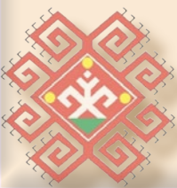
Рисунок выполнен А.Л. Кунгуровым.