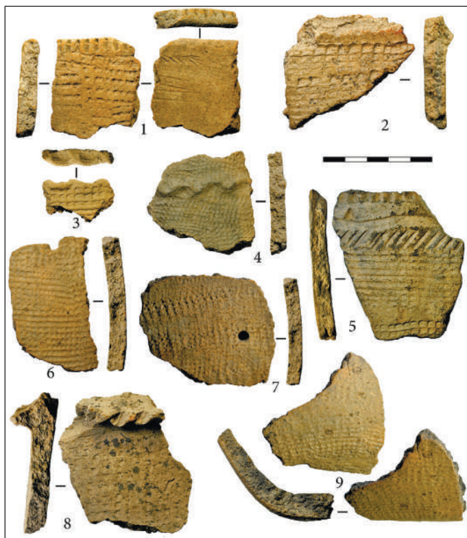
Рис. 2. Фрагменты керамической посуды из поселения елунинской археологической культуры